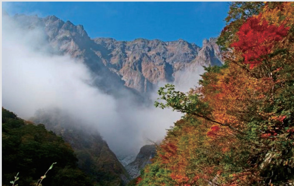
みなかみユネスコパーク