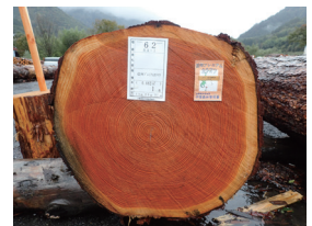
信州プレミアムカラマツ