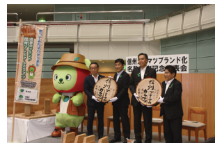
記念発表会の様子

高齢級カラマツは、強度に優れ、心材部分は銚色となるなど無垢の横架材(梁桁など)に適した特徴。平成29(2017)年10月の初出荷では、国有林から21本、民有林から12本を出品。