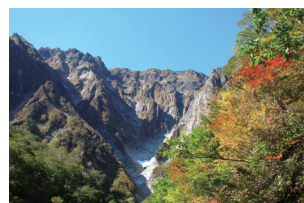
みなかみユネスコエコパーク

こうした中、平成29(2017)年6月、これら保護林等を含む地域である「祖母(そぼ)・傾(かたむき)・大崩(おおくえ)」(大分県及び宮崎県)及び「みなかみ」(群馬県及び新潟県)がユネスコエコパークに登録されることが決定。