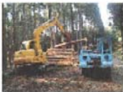
フォワーダとグラブによる集積