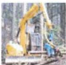
ハーベスタによる伐採及び造材