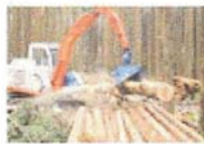
プロセッサによる造材