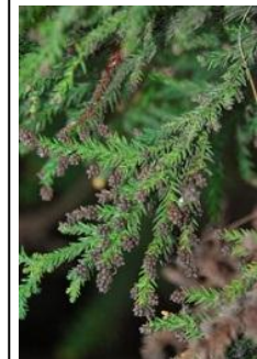
散布液により枯死した雄花