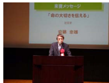
安藤忠雄氏によるメッセージ

その後、絵本作家の中川ひろたか氏によりオーサービジット特別版「ぼくのつくった歌と絵本」が行われ、続いて絵本翻訳者のみらいなな氏らにより「葉っぱのフレディ」パフォーマンスが行われました。