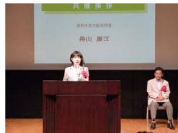
挨拶する舟山農林水産大臣政務官