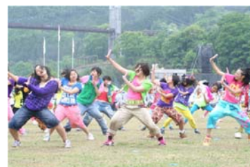
地元の子供達等によるアトラクション