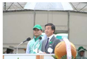
松沢神奈川県知事による主催者挨拶