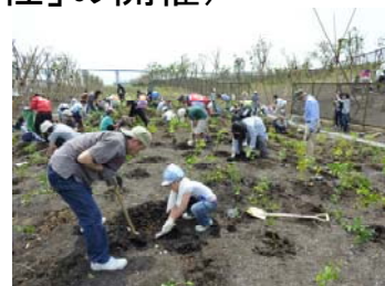
植樹イベントの様子

まず、東京湾の埋立地「海の森公園予定地」において植樹イベントが行われました。午前10時に、集まった親子によりカウントダウンが行われ、タブノキなどの照葉樹を中心に19樹種、計1,000本の植樹が行われました。