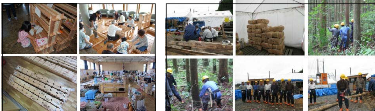
①避難所に組手什 くでじゅう の寄贈