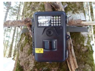
自動撮影カメラを用いたシカの出没状況調査