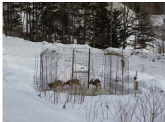
囲いわなによる捕獲

シカ被害の深刻な地域において、シカの生息範囲内にある複数の市町村や森林管理署から構成される広域の協議会が、シカ被害対策の計画を策定し、地域が連携して囲いわなやくくりわな等を用いた捕獲や、防護柵の設置等の防除活動を実施する。