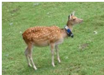
GPS首輪を用いた行動追跡調査

新たにシカの侵入が危惧される地域や、生息密度が高まりつつある地域において、シカの監視体制の強化を図るため、GPS首輪を用いた行動追跡調査や、自動撮影カメラを用いたシカの出没状況の調査等を行う。