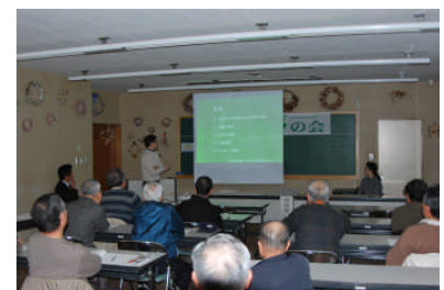
これまでの活動を振り返る発表の様子