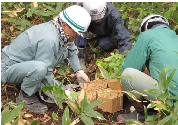
植樹箇所にカミネッコンを並べる北辰の社員