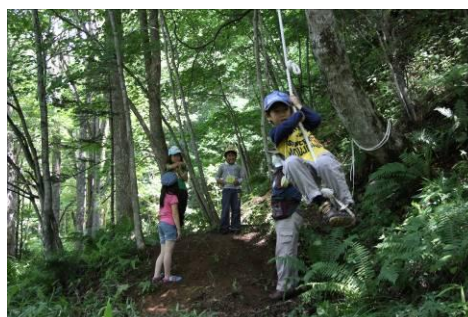
探検後、ターザンロープを楽しむ！

と声が挙がった。隊員たちは、双眼鏡や地図など探検七つ道具を手に、昆虫や動物の痕跡を観察、野鳥のさえずりに耳を傾け、様々な形をした木の葉っぱに気づき、こうして森の沢山の不思議を発見しながら1km余りのコースを元気に走破した。