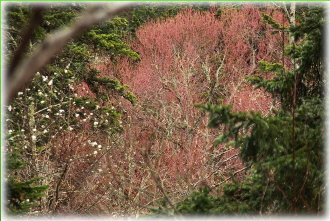
「オホーツクの森」春の紅葉

〒090-0035 北海道北見市北斗町3丁目11-3 TEL 0157-23-2960 FAX 0157-23-2472 http://www.rinya.maff.go.jp/hokkaido/tokorogawa_fc/