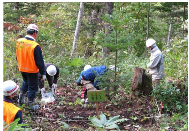
ミズナラの稚樹を試験地に植える塾生と学生

午後は、風倒被害地の試験地へ苗木植栽を行った。苗木は、モデル林内の作業道沿線に生えるミズナラの稚樹を採取。植栽は、指定された試験地へ巣植え（5～6本まとめ植え）や列状植えと変化をもたせた。朝からの共同作業で、塾生と学生たちは、すっかり息が合い、予定されたメニューを全てやり遂げた。「この森を来年も再来年も見たい」「この仲間たちと今後も作業したい」と嬉しい感想も聞いた。