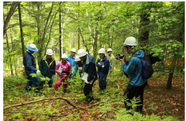
森林踏査に同行取材するNHK記者(右端)