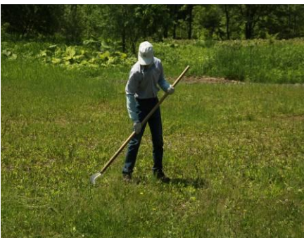
「森の家」周辺の草刈りの様子