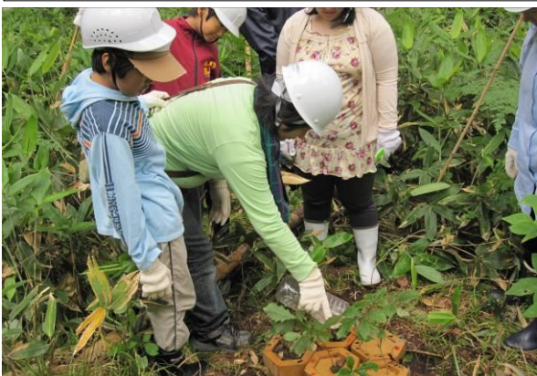
カミネッコンに散水する「生長の家」の家族

7月31日（日）、生長の家の夏季野外研修として、21名がカミネッコン植樹を行った。同団体は、「炭素ゼロ運動」の一環として、平成19年度から植樹等を行っており、今年で4度目のイベントとなる。同団体は、オホーツクの森にカミネッコン植樹を最初に行ったパイオニア的存在。また、家族連れでの参加者が多く、5年経つと幼児は小学生に、小学生は中学生にそれぞれ成長、時代の重みを感じさせられるイベントであった。