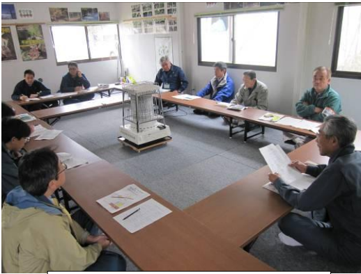
「森の家」での協議会の様子