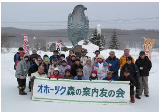
○と き：平成 24 年 2 月 26 日（ガイド支援 1 名他） ○場 所：置戸町鹿の子沢遊歩道 ○参加者：一般市民等 35 名