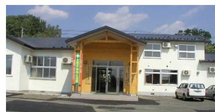
(正面玄関左側が当センター事務室です。)

北海道森林管理局 常呂川森林環境保全ふれあいセンター 090-0035 北海道北見市北斗町3丁目11-3 TEL 0157-23-2960 050-3160-6321 FAX 0157-23-2472