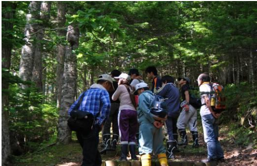
○と き：平成 23 年 7 月 23 日（ガイド支援 2 名他） ○場 所：幌岩山展望台遊歩道 ○参加者：一般市民等 35 名