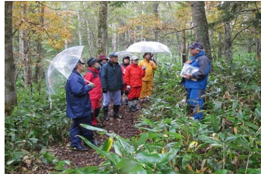
○と き：平成 23 年 10 月 15 日（ガイド支援 2 名他） ○場 所：古の森遊歩道 ○参加者：流水を守り隊の家族 19 名