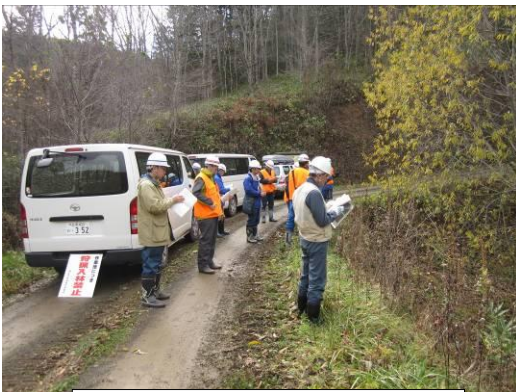
水棲生物調査箇所視察の様子

平成18年度に発生した低気圧による強風により樹木が倒れたエリアにおいて試験地を設定した。試験地は、立木のない区域と、立木が残っている区域の二区域に分けて、それぞれの区域において①刈り払い箇所、②地掻き箇所、③苗木植え込みの各3プロットずつ（2m×5m）合計6箇所を設けた。今回は、「森林づくり塾」の塾生が行った。「今後は、プロット箇所の草刈り等の手入れを毎年ボランティア等で行い、経過観察を行っていく」と説明。委員からは「エジシカの被害防止用のネット等を張って比較してみるのも良いのではないか」の意見が出され、来春の状況を見て協議会で検討していくこととした。