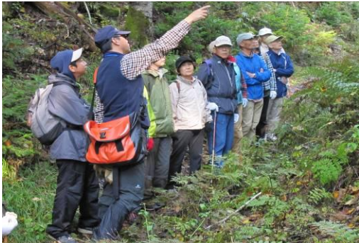
○と き：平成 23 年 10 月 8 日（ガイド支援 2 名他） ○場 所：阿寒国立公園オンネットー ○参加者：一般市民等 50 名