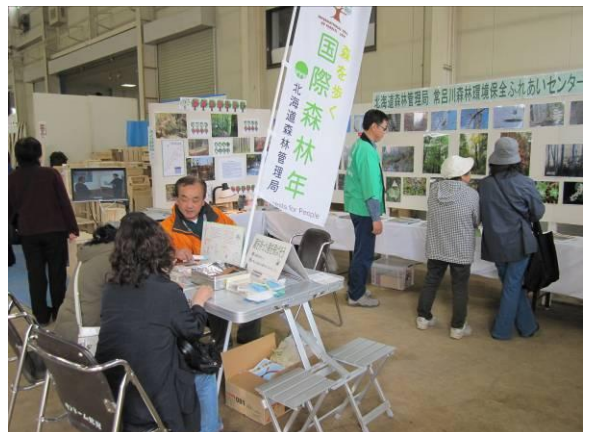
木フェスティバルの写真パネル展の様子