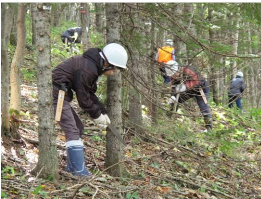
枝打ち作業を行う塾生と看護大の学生