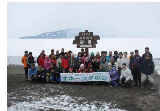
○と き：平成 24 年 3 月 3 日（ガイド支援 2 名他） ○場 所：弟子屈町ボンボン山 ○参加者：一般市民等 43 名