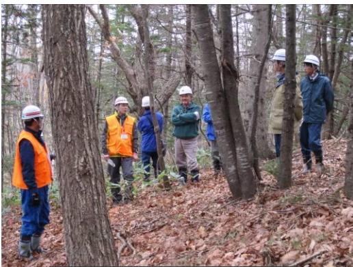
枝打ち実施箇所視察の様子

モニタリング調査は、年次計画に基づき、林分・植生・動物調査等を行っているが、より多様で総合的な森林機能を評価すべく、今年度、初めて水棲動物調査を実施した。自然再生モデル林周辺の森林は、過去における伐採等により、魚の姿が殆ど見られないと言われていた。調査結果として、ヤマメ、アメマス、フクドジョウ、カワヤツメ、ハナカジカ等が確認され、自然が回復傾向にあることが分かった。委員からは「資料を見て、どの位の河川規模なのかと思ったら、このような小さな沢にあれだけの魚類等がいることに驚いた。今後も調査を継続し、記録を引き継いで欲しい」との意見が出された。