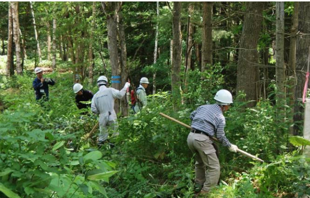
植樹箇所周囲の草刈り作業に取り組む参加者