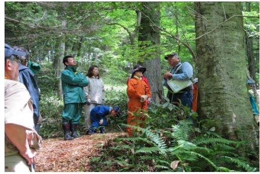
○と き：平成 23 年 7 月 2 日（ガイド支援 1 名他） ○場 所：平安の森遊歩道 ○参加者：社員・家族・ホーイカウト 26 名