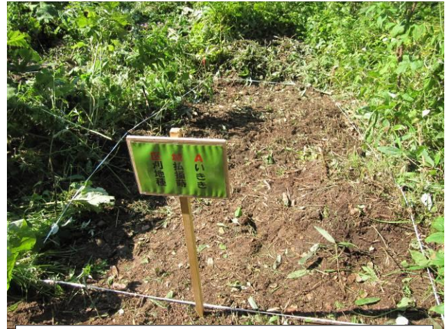
試験地は、周囲テープを張り、看板を立て完成