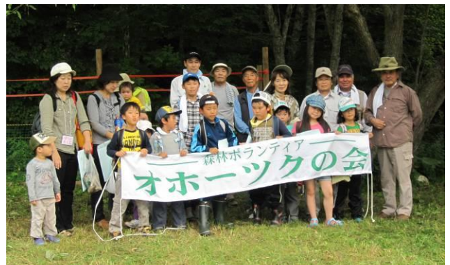
森の探検を終えて集合写真に納まる隊員と番人

隊員たちは、森の探検や物作り体験で完成させたお土産を両の手と胸に抱え「来年、また来る！」