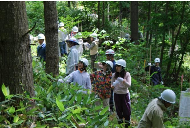
参加者が協力し、草刈り・シート補修作業を行う様子

7月23日(土)、森林ボランティア「オホーツクの会」主催によるオホーツク森づくりが開催され、会員や一般市民、網走中部森林管理署、日本赤十字北海道看護大の学生など総勢39名が参加し、カミネッコン植樹箇所の草刈りや食害防止シートの修繕作業を行った。また、昼からは、場所をサロマ湖畔にある幌岩山に移動し、森林散策と展望台からの眺望を楽しんだ。