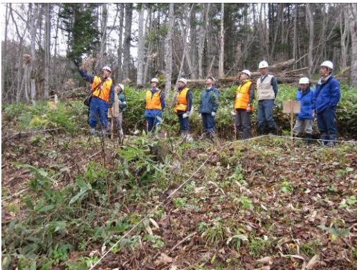
試験地設定箇所視察の様子

平成23年度のオホーツクの森自然再生モデル事業企画運営協議会（以下、「協議会」と言う。）は、10月27日と3月14日の2回開催された。昨年度の協議会において、本来、目指すべき市民参加型の自然再生モデル事業への方向性がより明確に示された。それを受けて、本年度は、風倒被害地における試験地設置箇所、水棲動物調査箇所及び枝打ち実施箇所における現地検討を行い、モデル事業の進捗状況を確認するとともに今後の方向性について協議された。また、3月の協議会では、1年間の自然再生モデル事業の総括を行い、平成24年度の活動計画について協議された。