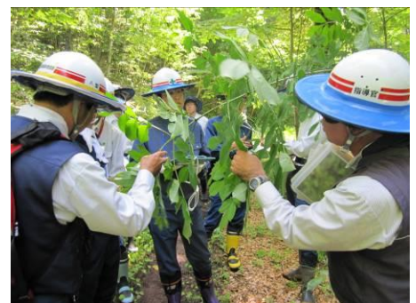
植物を手に特徴を調べる参加者

ムラサキツメクサ、ハウチャクソウ、ハンゴンソウ、エゾトリカブト・・・等々、一つひとつの植物の名前と特徴を説明しながら、平安の森遊歩道の森林散策を行った。午後からは、場所を古の森に移し、二人一組になって植物同定調査を行い、互いに研鑽を深めた。まとめでは「もう少し時間をかけてやって欲しい」との声が挙がり、次年度の課題となりました。