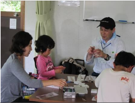
木ねんど作りを指導の藤生隊長