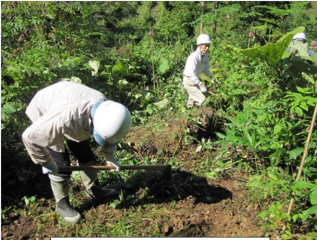
試験地設定作業に汗を流す塾生

午後は、試験地設定作業を行った。この試験地は、無立木地（立木が無い所）のA区域と多少立木が残ってB区域に、2×5mの長方形の試験地を①刈り払い箇所、②地掻き箇所、③植え付け箇所をそれぞれ設定し、今後、この試験地がどのように推移していくか経年観察を行うのが目的だ。A区域3箇所、B区域3箇所の計6箇所の試験地設定作業に塾生2名で班を編成し、それぞれ作業に取り掛かった。蒸し暑い中、しんどい作業となったが、1時間余で作業終了。立派に完成させた歩道と試験地を見つめる塾生たちは、達成感と充実感に満ちているようであった。