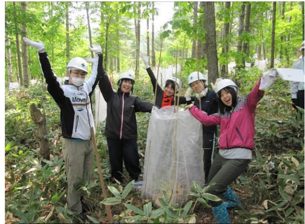
植樹を終えて笑顔で喜びを表現する教職員