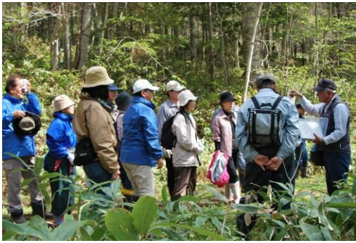
○と き：平成 23 年 5 月 25 日（ガイド支援 1 名他） ○場 所：平安の森遊歩道 ○参加者：一般市民 20 名