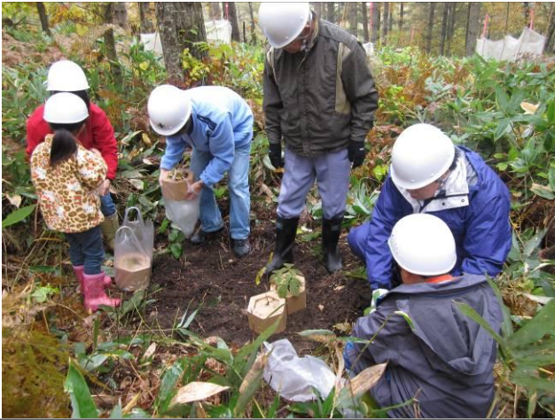
1個1個丁寧にカミネッコン苗木を並べる参加者

オホーツクの森における森林整備活動の今年度最後を飾ったのは、オホーツク観光連盟とオホーツク総合振興局主催の「流氷を守り隊」によるカミネッコン植樹だ。この日、あいにくの雨模様の中、オホーツクに森に集まった19名の親子は、流氷を守る願いを込めて、植樹作業に取り組んだ。作業を始める頃には、雨も上がった。1人1個のカミネッコンを完成させ、自然再生モデル林に、草を刈り、地剥ぎを行い整地し、そこに「大きくなれよ！」と願いを込め、植樹を行った。最後は、動物に食べられないように食害防止シートを巻いて完成。参加者からは「また、植樹を行いたい」「植えた木を見にきたい」との心強い声も聞かれた。「皆さんの今日の活動で約4畳の流氷が守られます」との主催者の挨拶が心に残った。