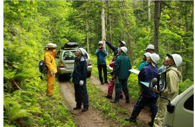
指導官から森づくりの説明を受ける塾生

座学のあとは、実際に生モデル林に入り、どのような山づくりを具体的に描くのか、全体像をつかんでもらった。また、自分の山であったら、どのようなことをしたいか。山は何を求めているか、考えてもらうように務めた。参加者からは「森林づくり塾の目的や流れが理解できた」との感想があった。また、この日、NHKからの取材があり、その模様は、ローカル版と全道版で放送された。