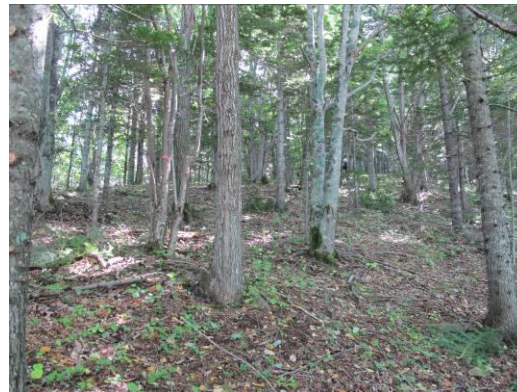
枝打ち作業後のスッキリした林内の様子

3回目の森林づくり塾は、10月1日、モデル林内で行われた。今回のテーマは、枝打ち作業と試験地への苗木植栽の林内での実技だ。参加した塾生は5名だが、日本赤十字北海道看護大の学生4名の若い援軍があり、塾生も勇気と元気をもらった。早速、塾生と学生がペアを組んで作業に取り掛かった。「上良し、伐倒方向良し」の声が林内に響き、枯損木が倒れる。ジャングルのような林内も塾生と学生の頑張りで林内は見事スッキリになった。