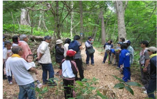
○と き：平成 23 年 7 月 31 日（ガイド支援 1 名他） ○場 所：平安の森遊歩道 ○参加者：生長の家の家族 21 名