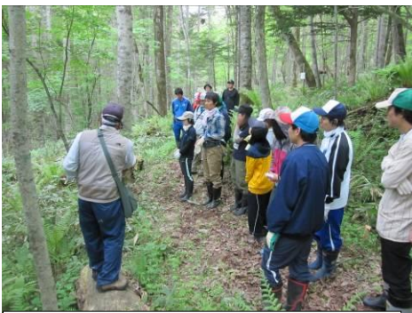
「古の森」での自然観察の一場面

平成 23 年度の教育関係機関等と連携した取り組みは、6 月 9 日(木)に新任の教師等 19 名を対象に、古の森遊歩道で初任者研修（自然観察基礎講座）が実施された。