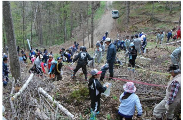
国際森林年ボランティア植樹の様子

道内最初の国際森林年記念行事となることから、北見事務所、森林管理署、当センターと実行委員会とが一体となって取り組み、盛会に終え、次の開催地に国際森林年のタスキを渡しました。併せて、山菜採りと森林散策会も行われました。