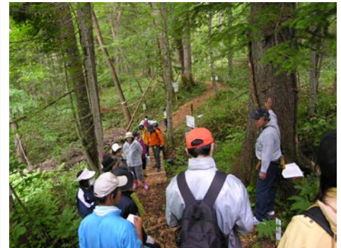
(エゾマツの大径木)