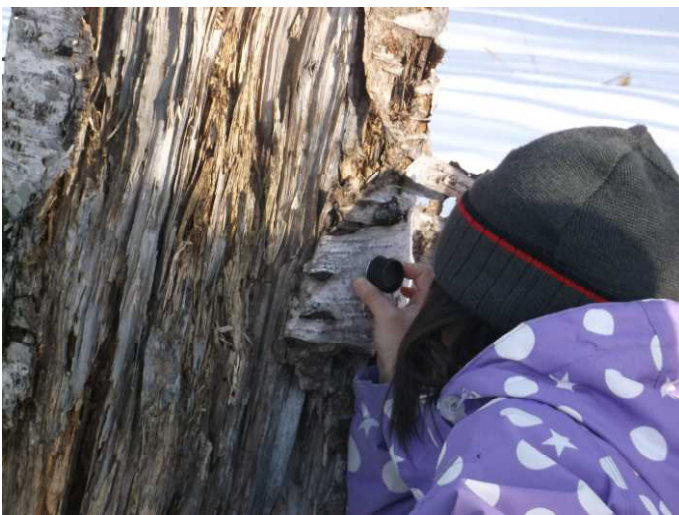
▽樹皮を拡大レンズで観察

この「どきどき！探検タイム ビンゴ」とは、自然観察をビンゴというゲーム感覚で行うもので、色や手触り、見た目により、森林には面白いものや不思議なものがあることに