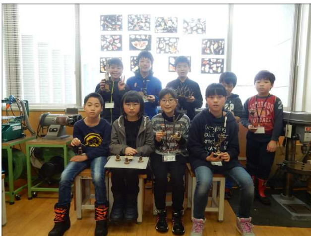
▽作品を持寄り記念撮影

子どもたちからは「落ち葉のスタンドグラスを窓に貼るときれいだった。」や「マツボックリの工作が楽しかった。」等の感想が寄せられていました。