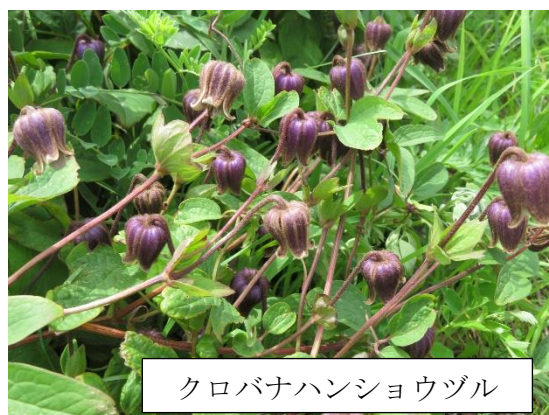
クロバナハンショウヅル

ハマナスの甘い香り、クロバナハンショウヅルの群落、懐かしいミズチドリ、ムシャリンドウ、ミヤコグサ・・・。