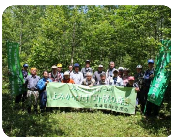
参加されたみなさんお疲れ様でした

初めての参加者もいる中、途中、休憩を取りながら、みなさん爽やかな汗をかいていました。