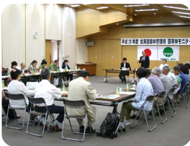
悪天候の中、ご来庁いただきまして感謝申し上げます

7月2日、北海道森林管理局大会議室において、平成28年度の国有林モニター会議を開催しました。今期（平成28年4月から平成30年3月までの2年間）の登録者は48名で、今回の会議はモニターの皆さまが初めて顔を合わせる第1回目の会議となり、遠くは中頓別町、網走市、上ノ国町など、全国各地から29名の参加をいただきました。