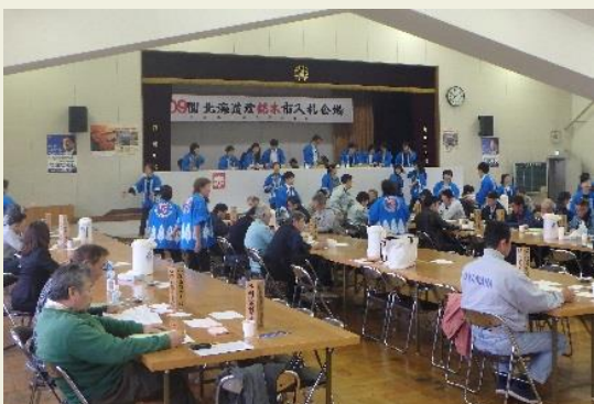
旭川銘木市での入札の様子

広葉樹の伐採時期は、これから冬期間にかけてピークとなります。昨年1月の出品量は民有林材も含め全体で約3,000m³であったことから、冬季に向けて国有林材、民有林材共に広葉樹の出材は増えてくると考えています。