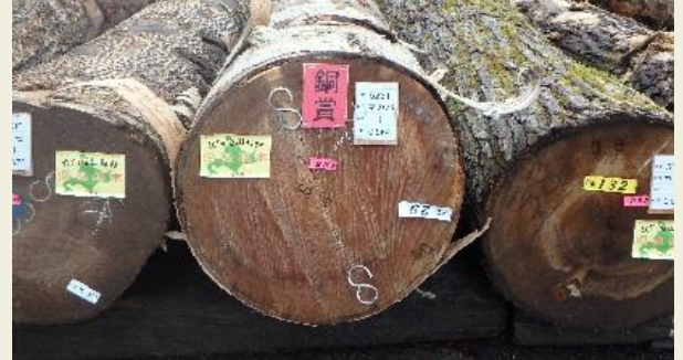
旭川銘木市に出品されたウダイカンバの優良材

北海道産広葉樹については、ウダイカンバ、ミズナラ、セン、ヤチダモ等の優良材が、突き板(※1)や高級家具材、ウイスキー等の樽材として注目されているだけでなく、今まで製材としてあまり利用されなかった、シラカバやハンノキ等の中小径木も有効に利用されてきています。