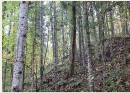
人工林の中に点在する広葉樹

北海道は、ミズナラ、ウダイカンバ、ヤチダモ、セノキ、イタヤカエデなどの広葉樹資源が豊富であり「広葉樹の産地」として知られてきました。特に、旭川地域は広葉樹製材品関係の工場や木材取り扱い業者が多く、北海道はもとより全国屈指の広葉樹の集散地として名を成しています。