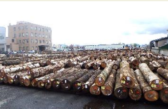
旭川銘木市での展示状況

しかしながら、貴重な広葉樹資源を有効に活用し、北海道内外の広葉樹の需要に少しでも対応するため、山