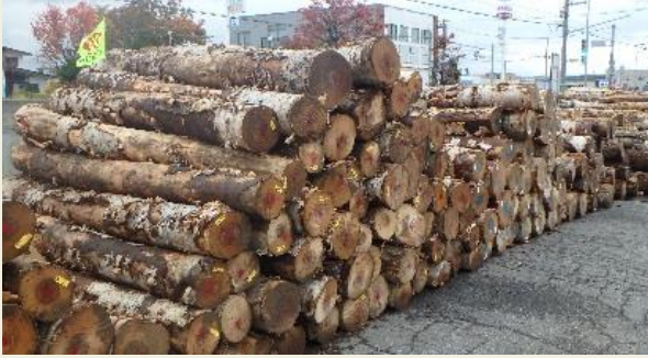
旭川銘木市に出品された広葉樹の小中径木

北海道森林管理局では、貴重な広葉樹資源を有効に活用していただくため、これからも銘木市へ積極的な出品を行い、さらに、銘木以外の広葉樹一般材に関しても、より効果的な利用がされるよう取り組んでいく考えです。