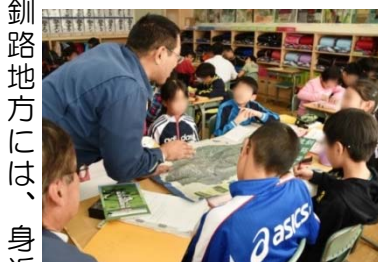
地図で森林の位置を説明

釧路地方には、身近な環境教育の場として釧路湿原があるため、森林が霞んでしまいましたが、当センターでは、今回のように釧路湿原自然再生協議会と連携した環境教育の実施を含め、国有林をフィールドにした森林環境教育、森林教室等への支援、技術指導を行っています。