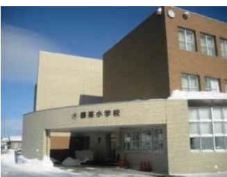
標茶町立標茶小学校

そこで、地図と衛星写真を使い、釧路湿原周辺の川と森林の位置を確認して、釧路湿原の水が広大な地域から集まっていること。川の upstream に森林があることを確認してもらい、森林の持つ機能、降った雨水の行方等の説明を行いました。