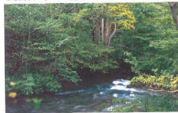
●森林にふった雨水は一度には流れない