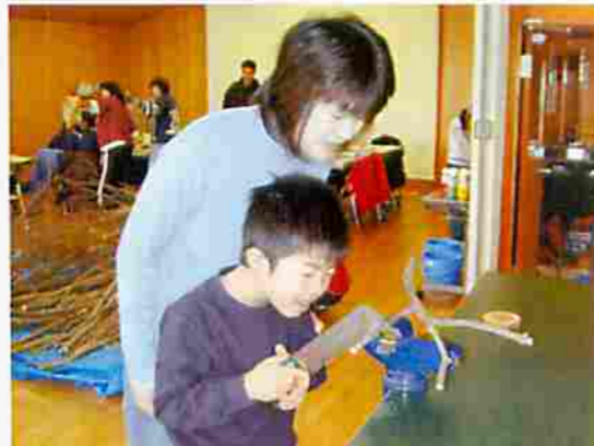
ケガしないよう両手で切りました

会場は、終始、楽しそうな話し声や笑い顔でなごやかな雰囲気に包まれ、自然の素材を使い素晴らしい作品を親子で作って、子供達は「冬休みの宿題ができた」と喜んで帰っていきました。