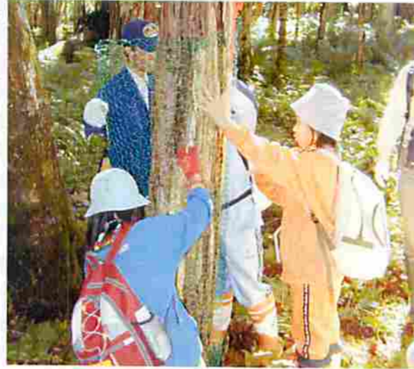
地元の小学生と一緒に網を巻きました

調査区はイチイ林木遺伝資源保存林に指定されていることから、イチイを樹皮食害から保護するため、平成12年の秋に樹皮食害防除網を調査区内のイチイ約100本に巻き経過をみています。更に、15年度から、町立知床博物館と共同で地元の小学生と一緒に樹皮食害防除網を巻くイベントを実施し、被害の状況や森林の大切さを伝えています。網巻きをしたイチイは被害が拡大していない状況にあり、これからもイベントなどを通じ食害防除網を巻いていきたいと考えています。