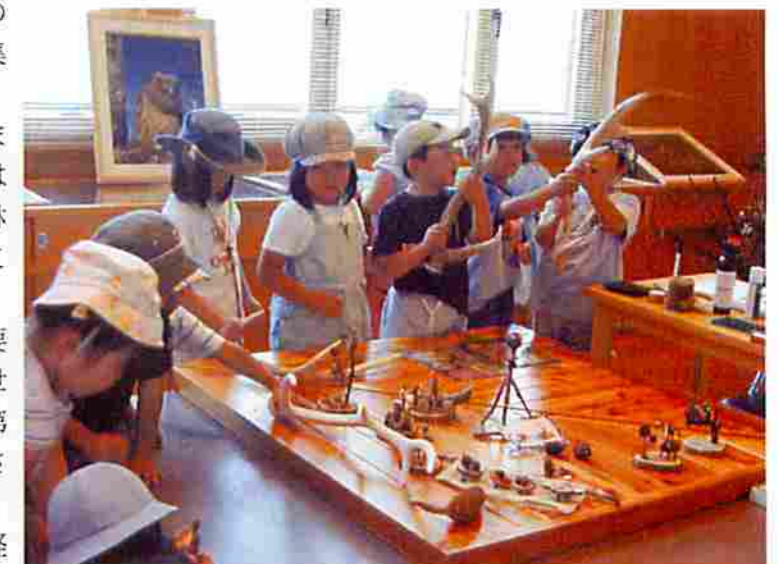
地域の皆様に親しまれる センターでありたいと考えます

私たちは、候補地の大部分を管理経営する機関の一員として、これまで以上に地域の皆様方とひざを交えて、「知床は今後どうあるべきか」などについて議論していかなければならないと考えていますので、引き続き関係各位にはご指導、ご協力を賜りますようお願いいたします。