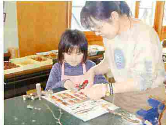
お母さんが手を添えてくれました