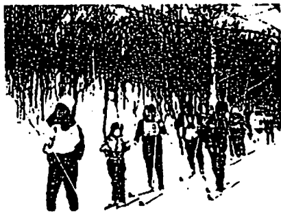
〔森林レクを楽しむ参加者たち〕

両日とも早春の穏やかな陽に恵まれ、コースにはまだ1mを越す残雪と起伏に富んだ樹林内を森林インストラクターのガイドで7歳から76歳まで幅広い層の人々が元気に歩きました。約7kmのコース沿には春を待つ膨らみかけた木々の芽、うっすらと積もった雪上に残されたキタキツネ・エゾライチョウの足跡、クマゲラの食事跡と鳴き声、そして立ち木に刻まれたヒグマの爪跡など・・・観るもの全てが写真・映像では味わえない「3次元の自然の素晴らしさ」に「トレンディ」と叫ぶ声も聞かれました。