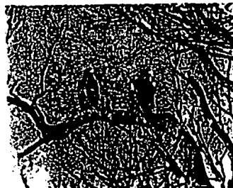
〔雪上で見むオオワリ〕

知床沿岸から流氷が去って約1ヶ月、海岸線の荒々しい岩場には、掃りそびれた流氷塊が漂着時の鮮やかなパールグレーから乳白色の雪塊のように顔負けなく変貌し、長い知床の冬の終わりを告げるかのように横たわっています。