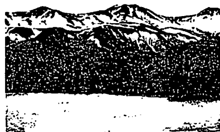
〔氷結した知床五湖から知床連山を望む〕

「知床半島に連想するもの」といえば殆どの人が「知床五湖」と答えるほど知床の代表的景勝地となった五湖。大小五つの湖が寄り添うように狭い半島の一端に集まっており、それぞれの湖名も一湖・二湖・三湖・四湖・五湖と忘れようにも忘れられない名が付いています。この五湖は知床硫黄山の山体崩壊によって大量の礫が運ばれ、その凹地に地下水が顔を出し形成されたものですが、流れ出る湖口もない五湖の水は溶岩と溶岩礫の間隙をくぐり抜け、100m以上もある断崖から一気にオホーツク海に落ち込んでいます。