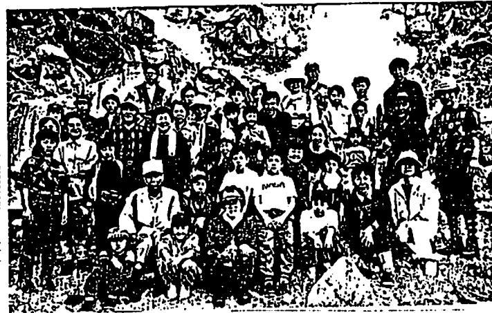
新噴火口で噴き上げる蒸気をバックに参加者記念撮影

噴火口から噴き上げる蒸気、荒涼とした自然景観に驚きの声を上げていました。お楽しみ時間には、勢いよく噴き上げる蒸気でのゆで卵作りでは「お母さん、これまだ生だよ」との声や、雄大な自然のパノラマを見ながら、お母さんの手作りの美味しいお弁当をほおばる子供達、真赤なコケモロの実に口を染める人など、十分に自然を満