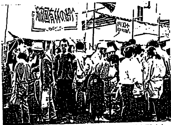
知床国有林の紹介コーナーで航空写真立体鏡を覗く人々

また、二百六十年の輪切材展示には「江戸時代から生えていたの」「一年にこれしか生長しないの」「どうして年輪をささむの」などの質問が数多くあり、にぎやかな一日を過ごしました。なかでも直径六十八センチのセンノキの年輪当てクイズには、百名以上の応募があり、正解者には木製の記念品を贈り