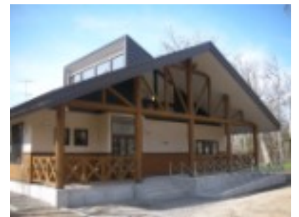
知床ボランティア活動施設

知床に関する映像や書籍も多数用意しております。どうぞお気軽にお立ち寄りください。