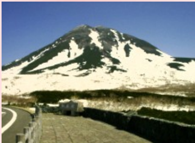
知床横断道路山頂展望台

私も早速、ドライバーに混ざり羅臼側までドライブに行ってきました。車の窓を全開で走ると、標高が上がるにつれ、凛と冷たく澄んだ空気が車内に流れてきました。知床峠の展望台付近では、まだ多くの雪が残り、ゴツゴツとした岩肌と、緑のハイマツが作る高山特有の景色が青空に映えていました。まだ、葉が生え揃っていないため、森は裸の状態でしたが、耳をすませば雪解け水の音が聞こえ、地表には芽が顔を出して、しっかりと春を感じる事ができました。