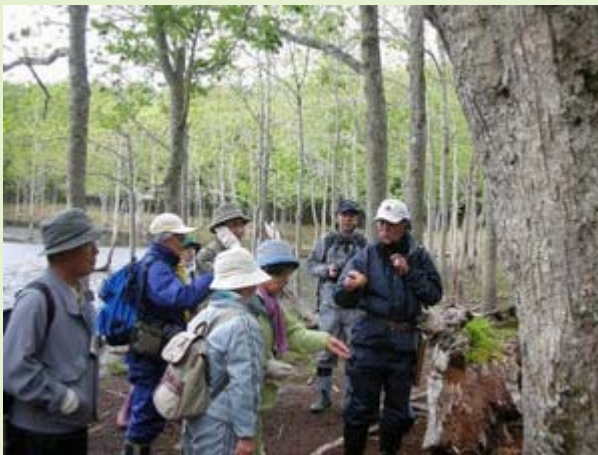
樹木医の先生からの解説の様子。

午後からは、参加者が自ら木を切り、ドリルで穴を開け、菌を打ち込んでシイタケのほだ木を作りました。来春以降4～5年程シイタケが採れることから、参加者は嬉しそうに、自分で作った木を持ち帰っていました。