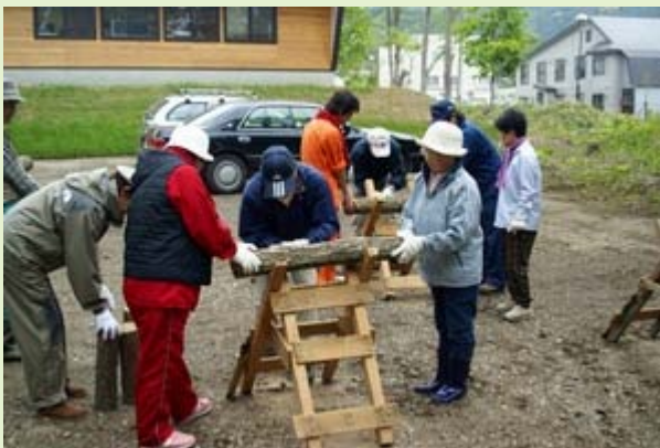
シイタケのほだ木作りの様子。