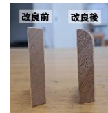
写真6 飲み口の改良

口にあたる部分が角ばっていて飲みづらいとの意見もあったため、飲み口の部分は内側に向けてアールを施すこととしました。