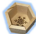
図 オリジナル酒杓試作品

私たちは町産材のシラカンバを使用した製品開発をスタートし、上川町には上川大雪酒造があること、また雪をイメージして六角形の酒杓を試作することができました（図）。