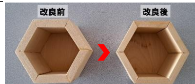
写真5 酒杓の側板の厚さの改良

既存の厚さ10mmから、見た目、口当たりを班員たちで総合的に評価し、側板の厚さを8mmに改良することにしました。