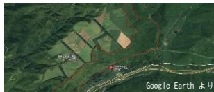
写真1 旭川農業高校の天幕演習林

本校演習林（写真1）の所在地でもある上川町は、最盛期にとても活気のあった林業が、近年では著しく衰退していることを知りました。昨年度、日頃からお世話になっている上川町へ恩返しできないかと考えていたところ、上川町の森と人をつなぐ製品制作の依頼を上川町よりいただきました。