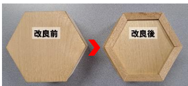
写真3 酒杓の底板の改良

しかし、試験終了後、木材が水分を吸収して乾いたことで、とくに底板が変形してしまいました。そこで、底板を下から貼り付ける構造ではなく、側板にはめ込む構造にし（写真3）、表面には自然由来のオイルを染み込ませました。そして同様の試験を実施した結果、水漏れはなく、その後の変形も確認できなかったことから耐水性試験をクリアすることができました。