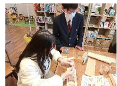
写真7 ワークショップの風景

オリジナル酒杓ワークショップは、12月17日に上川町のPORTOで、1月16日には旭川西イオンで実施しました。様々な年齢層の方に体験していただき、上川町について知ってもらえる機会となり、所期の目的を達成することができました。