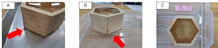
写真2 酒杓の耐水性試験

試作品の水漏れや変形試験を実施しました。試験方法はA、B、Cの酒杓を用意し、それぞれに水を入れて水漏れや変形などの変化が現れるのかを観察します（写真2）。