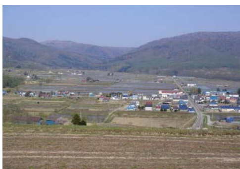
稲作地域の奥に広がる国有林