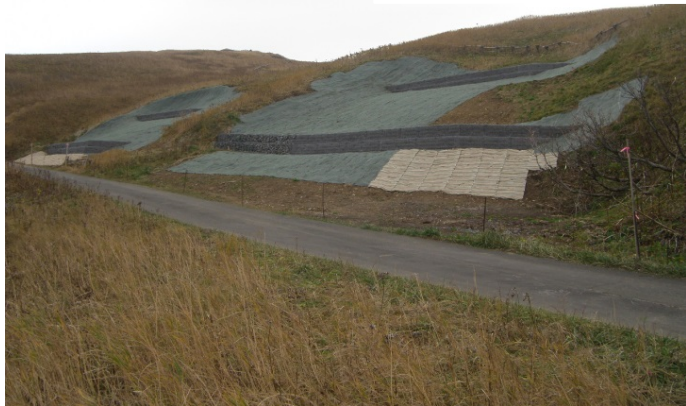
第6・7・10・11号土留工