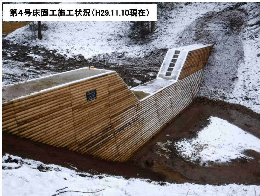
第4号床固工施工状況(H29.11.10現在)