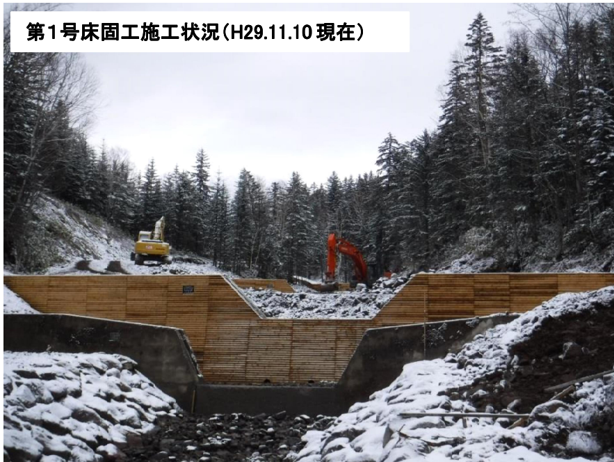
第1号床固工施工状況(H29.11.10現在)