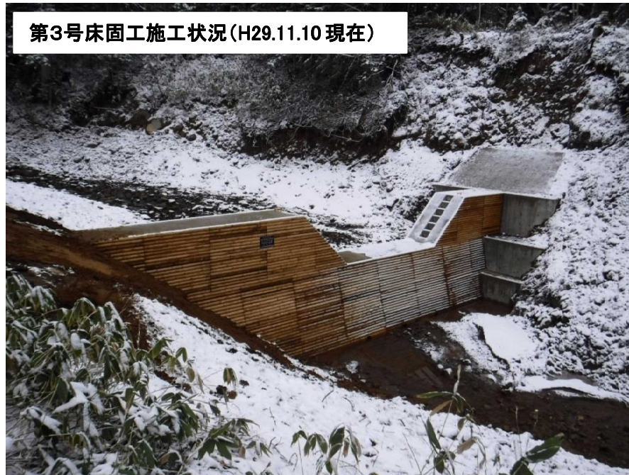
第3号床固工施工状況(H29.11.10現在)