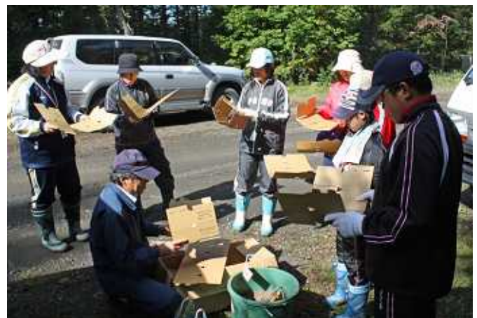
カミネッコンによる苗木作り