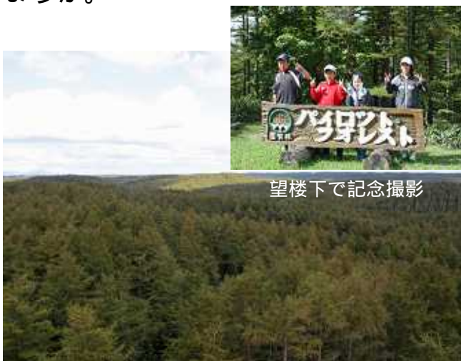
望楼下で記念撮影