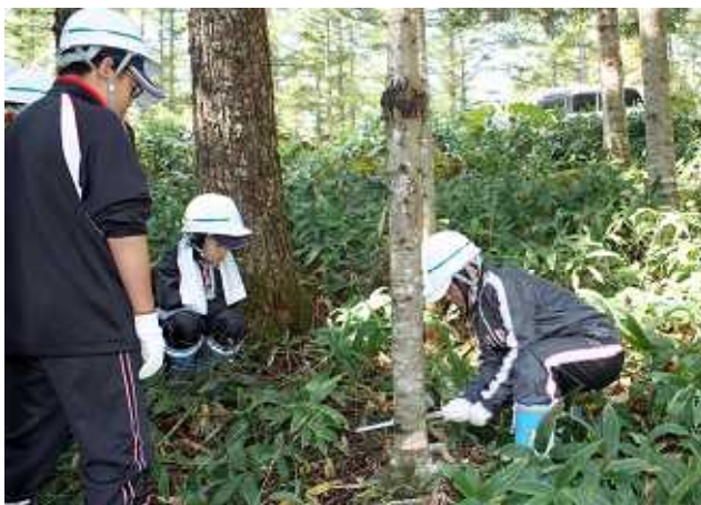
間伐体験でトドマツを伐倒