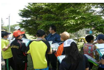
校舎前の植え込みで