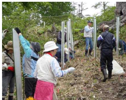
「第1回 ドングリ倶楽部」

雨が一休みしている間に、植樹活動を行い、午前中で作業は終了。昼食後、再び雨が降ってきたので、予定を変更して釧路に帰ることになりました。6月17日（水）には、雷別ドングリ倶楽部が第1回目の活動を行いました。今回は、植樹とツリーシエルトのメンテナンス等を行なっています。