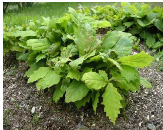
ドングリが発芽しました。