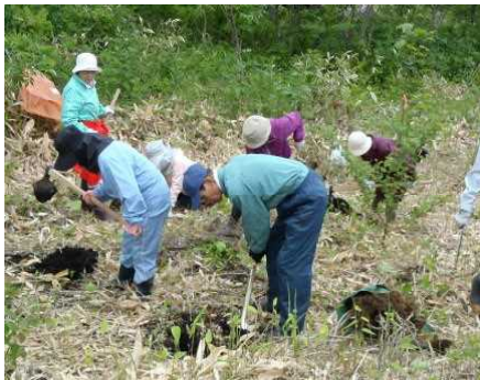
「雷別へ植樹に行こう！」

先月は、各地で植樹祭など木を植えるイベントが多く行われました。当センターも、雷別自然再生事業地で、広葉樹の苗木（ハルニレとヤチダモ）を用意して、ボランティア植樹「雷別へ植樹に行こう！」と第1回「雷別へ植樹に行こう！」の植樹イベントを行いました。6月13日（土）に行ったのが、ボランティア植樹「雷別へ植樹に行こう！」のイベントは、新聞、釧路湿原自然再生協議会、再生普及行動計画オフィスが配信する「ワンダグリ」ホームページ、北海道森林管理局のホームページ等で参加者を募ったものです。本番に向けて、着々と準備が整っていき、この週末、週間天気予報の13日に傘マークが現れ、なかなか消えてくれませんでした。結局、雨の予報で当日を迎え、出発直前に降りだした雨のなかを出発。しかし、釧路町から標茶町に入ったころから道路が乾燥路面に変化してきました。