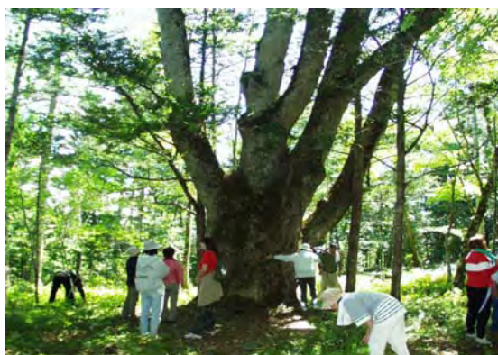
(標茶町国有林ミズナラ巨木)

6月の釧路市立寿小学校に続いて下記の小中学校等より依頼があり実施を予定しております。