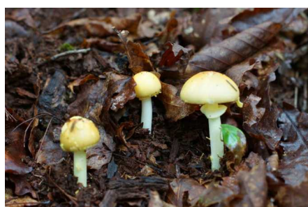
コガネテングタケ 食毒：有毒