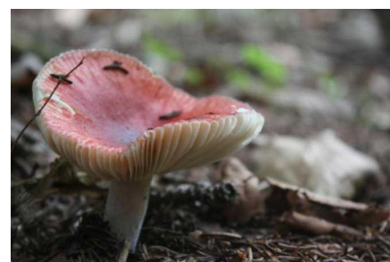
ドクベニタケ 食毒：不適