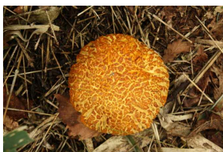
アカヤマドリ 食毒：食