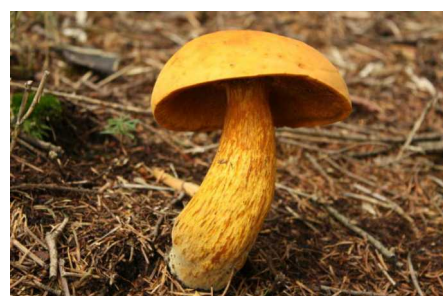
コガネヤマドリ 食毒：不明