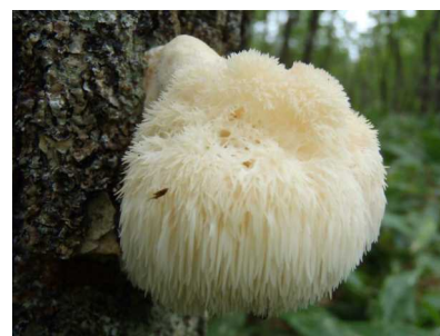
ヤマブシタケ 食毒：食