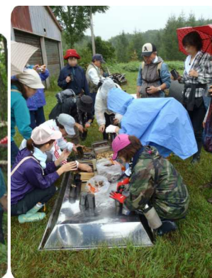
↑ 釧路市内の美容師13名で傘をさしての森林浴と飾り炭作り ↑