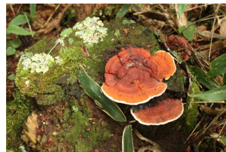
レンガタケ 食毒：不明