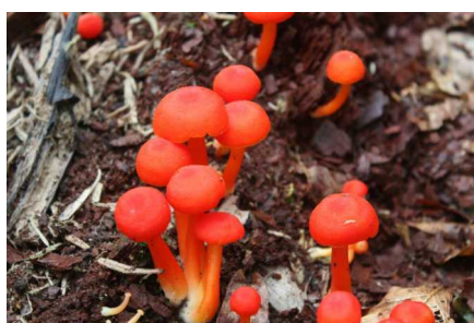
ヌメリガサの仲間 食毒：不明