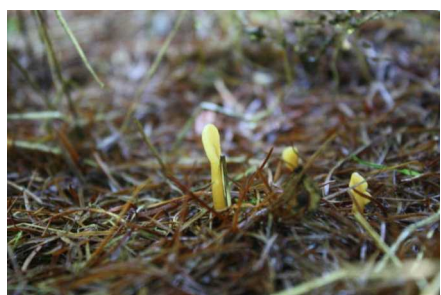
ヘラタケ 食毒：不適