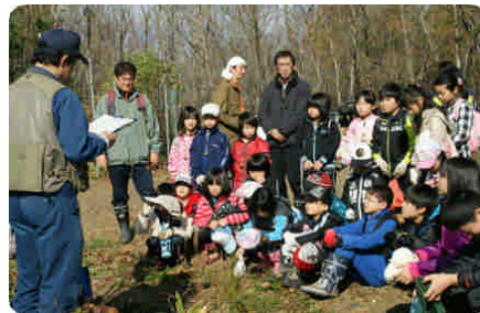
森林と野生動物のお話 ↑

巣箱の清掃では、昨年設置した巣箱が利用されていないか一つ一つ確認しながら中のゴミを出し清掃作業を終えました。