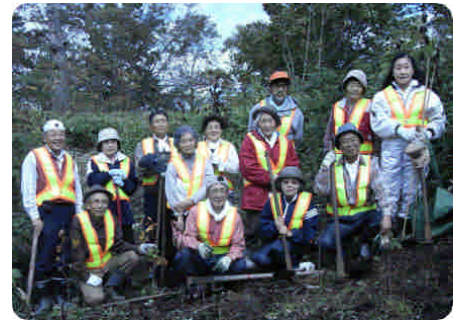
↑ 植樹後の記念撮影