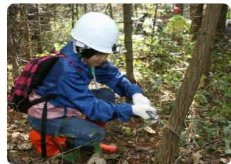
↑ 成長を邪魔している木を切る除伐作業中

ミニ森林教室では、学校の名前になっている柏(カシワ)の特徴と葉の形が似ているミズナラの木の違い、トドマツとアカエゾマツの違いを実際に手で触れるなどして確認しました。また、育樹祭の思い出として、学校に戻ってから行うパウチはがきづくりに使用するイタヤカエデなどの木の葉拾いを行いました。