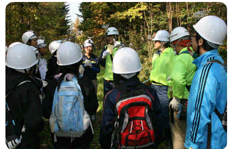
↑ パウチはがき(木の葉拾い説明)