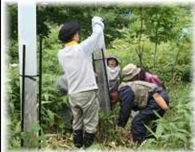
ヘキサチューブ撤去作業

ヘキサチューブとは、植栽木を鹿の食害から守るため木に被せたチューブです。植栽木がヘキサチューブより大きくなり鹿の食害を受けるおそれなくなったので撤去しました。植栽木の中には、成長が良いため簡単に抜けなくなりヘキサチューブを壊し撤去したものや、チューブを抜いた後支えがなくなり倒れてしまう植栽木など様々でしたが、立派な森林になることを願い撤去作業を行いました。