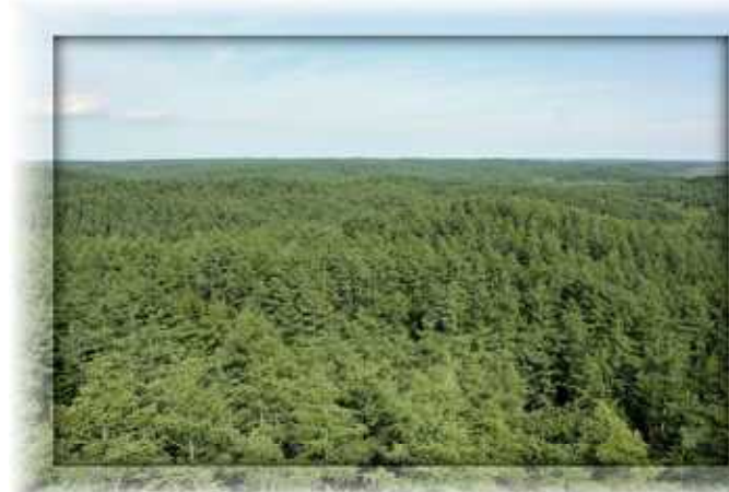
望楼から見たカラマツ林

中を通る遊歩道を散策し、別寒辺牛湿原の際まで降りて湿原植物を観察しました。さらに、パイロットフォレストの望楼に登り、約1万ヘクタールに及ぶ根釧原野の荒地を森林に再生させた様子を見てもらいました。参加者の皆さんは、地平線まで続くカラマツ林の広がり驚きの声を上げていました。