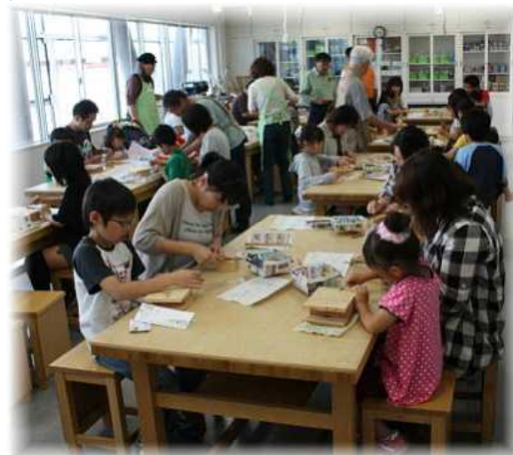
「私だけのお箸」作りに参加した親子

最後にクルミの油をぬり、木目や木の色が鮮明になると、皆、大喜びの様子でした。ヤスリかけに少し時間が掛かったものの「箸」の出来上がりは、上々でした。