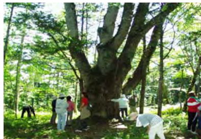
(標茶町国有林・ミズナラ巨木の前で森林教室)

それぞれ数に限りはありますが『森林は友達』は子どもたちにも渡せるよう考えておりますのでご要望があればお知らせ下さい。