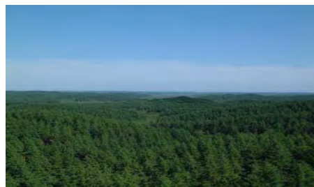
から別寒辺牛湿原を望む)

アンケート 5月末に主な活動区域内及び釧路市の各小中学校を対象に今後のふれあいセンター業務の参考とするため森林環境教育について実施しました。 まだ集約の途中ですが、