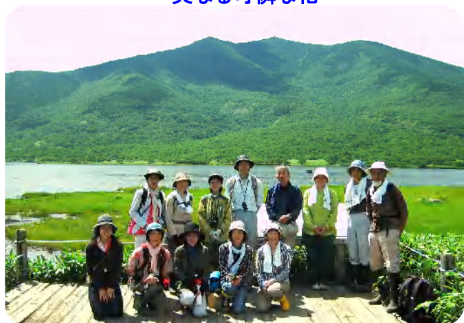
←3班の皆様 ↑2班の皆様

世界に誇る知床・羅臼湖の森林について理解を深めていただけたでしょうか？皆様、大変お疲れさまでした！！