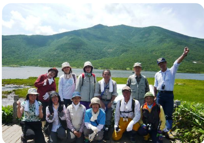
↑羅臼湖を背景に撮影。1班の皆様