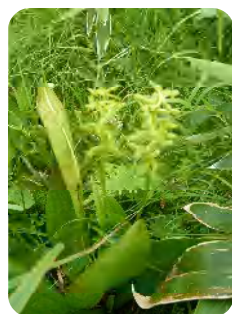
ホソバナキソチドリ