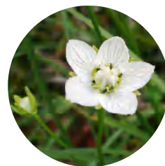
モウセンゴケ→食虫植物のイメージと異なる可憐な花