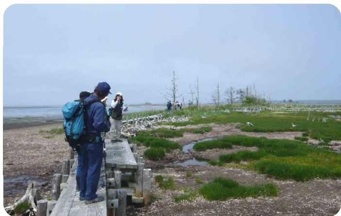
トドワラについて解説

地盤沈下や高潮などが原因で、衰退しているトドワラ。この景色はあと何年続くでしょうか。