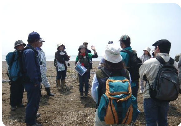
野付半島について意見交換！

今回の参加者の皆さんは、根釧地域にお住まいの方々です。トドワラがまだ森林だった頃の話聞き、とても勉強になりました！