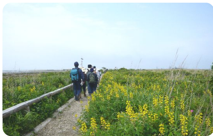
センダイハギのお花畑を通過。