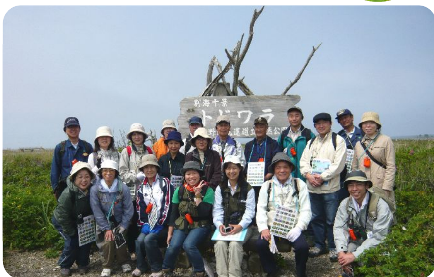
笑顔でハイっチーズ！

今回の参加者の皆さんは、根釧地域にお住まいの方々です。トドワラがまだ森林だった頃の話聞き、とても勉強になりました！