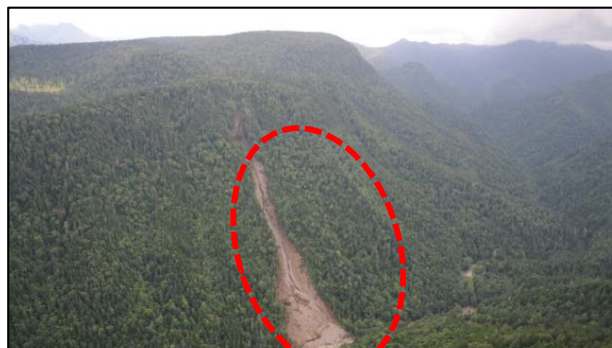
きたみ るべしべ ③ 北見市留辺蘂(無加川本流林道沿い)