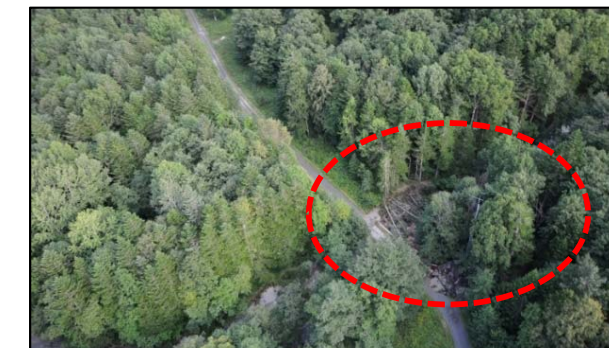
おけと ④ 置戸町(平の沢林道橋梁沿い)