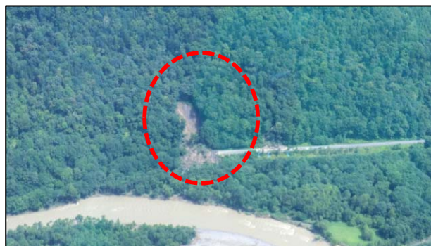
かみかわ ① 上川町(道道 中愛別上川線沿い)