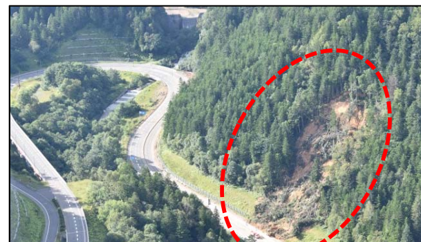
きたみ るべしべ ② 北見市留辺蘂(国道39号線沿い)