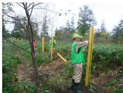
▽保護管設置の様子

まず始めに、企業の代表者から開会のご挨拶をいただき、続いて、当センター所長から遠方より来ていただいたお礼と植樹の意義とSDGsについての話、また企業による社会的貢献活動の感謝を交えて挨拶を行い、その後、参加者は、植樹班と保護管組立班に分かれ、それぞれの班で当センター職員による現地案内などを受けながら森林づくり活動に取り組みました。