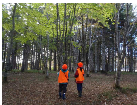
▽樹木の勉強をする研修生の様子

木を少しでも多く覚えてもらえればうれしく思います」などの挨拶があり、その後、昼食箇所も兼ね、道の駅「厚岸コンキリエ」に立ち寄り、帰路につきました。