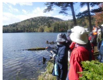
▽オンネトーの景観

この会は、高齢級のトドマツ人工林が気象害によって立ち枯れし、笹地となった箇所が広がっている雷別国有林をフィールドとして、平成19年から当センターと協働で森林再生に取り組みされている森林ボランティアの方々を集まりです。