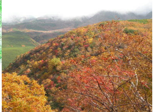
弥三吉水手前硫黄山方面（10月7日）