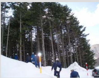
(間伐する前の様子です。)

間伐前後の現地視察と間伐実施等の意見交換や現地に沿った森林の取り扱いへの理解をより一層深めました。