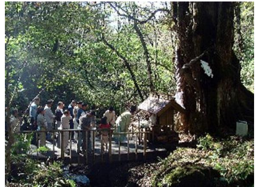
(左) 「縁桂の森」入り口 (上) 「縁桂森林フェスティバル」では参拝もされた。