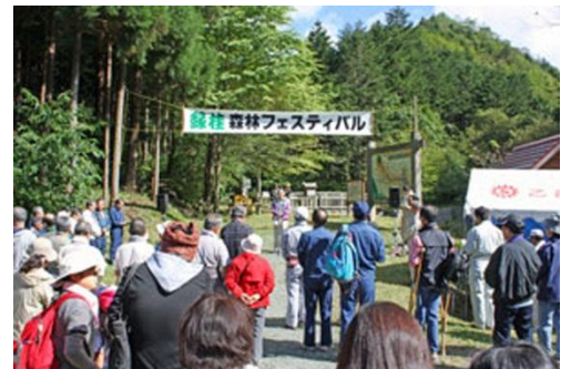
「縁桂森林フェスティバル」での散策会の様子