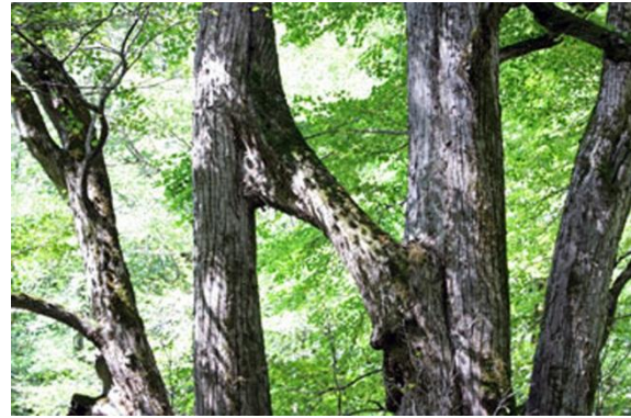
2本の枝が結合し、「連理の木」となった。