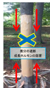
図1 巻き枯らし間伐