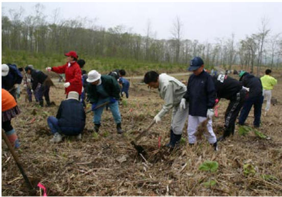
歴舟川の清流を守る会の人たち