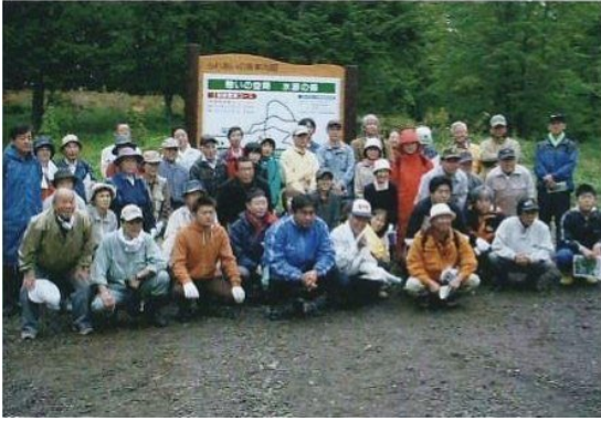
ふれあいの森「憩いの空間・水源の森」 オープン式