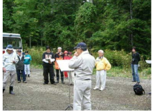
陸別町議員のハーモニカ演奏で歌い祝う オープン式