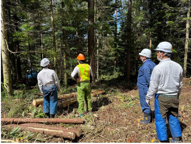
FSC森林認証の現地審査