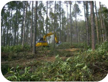
ブラッシュカッター地拵え