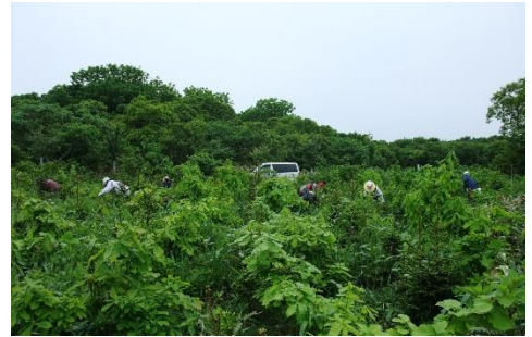
ボランティアによる下刈作業