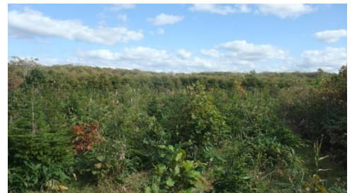
アカエゾマツ・カシワ植栽箇所