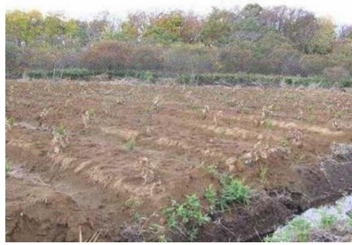
未立木地への植栽 (アカエゾマツ・カシワ)