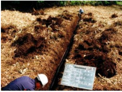
あんぎよ 暗渠排水管設置作業