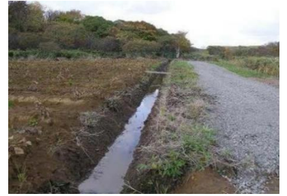
明渠工と作業道作設