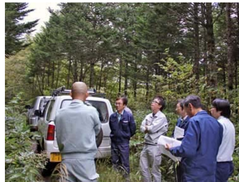
(上)運営会議の様子