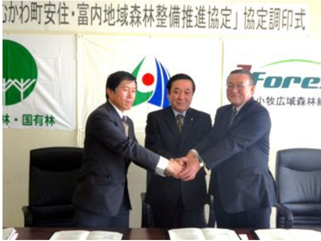
(左から) 二村胆振東部署長、山口むかわ町長、 小坂若小牧広域森林組合代表理事組合長