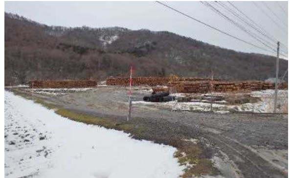
（上）森林作業道選定のための現地調査 （下）整備されたストックヤード