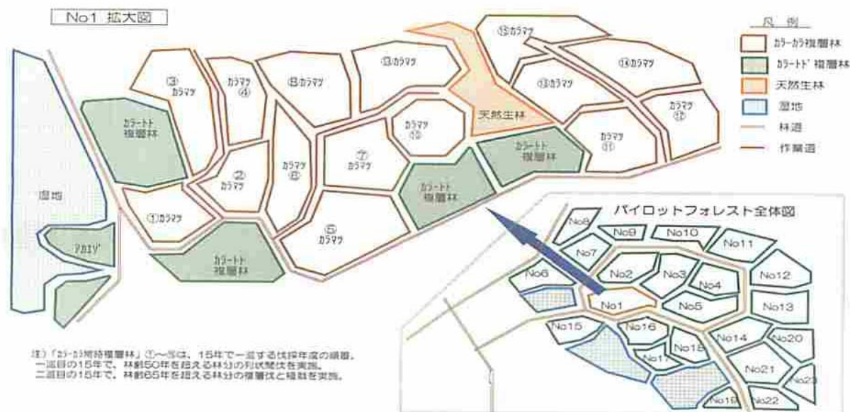
(施業の小規模・分散化の概念図)

なお、パイロットフォレストは、別寒辺牛湿原と湿原に流れ込む小河川を取り囲むように存在することから、水質の保全や野生生物の生息環境の保全に留意する必要がある。このため、常時水流のある溪流端から両側30mの区域及び湿地の周囲30mの区域について、水質の保全及び野生生物の保全を図る水辺林として設定する。水辺林の取扱いとして、天然林については、原則として人為を加えることなく自然の推移に委ねる、人工林については、抜き伐りにより積極的に広葉樹等の導入を図り、針広混交林への誘導に努め、将来的には天然林に誘導するものとする。