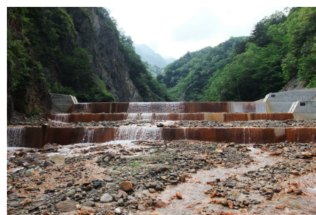
土砂整理後の黒岳沢