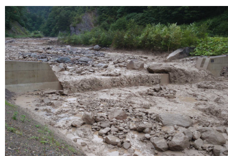
平成22年発生の土石流