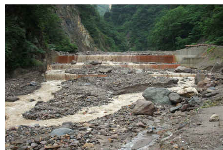
土石流発生直後の黒岳沢