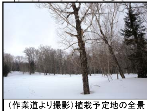
(作業道より撮影)植栽予定地の全景