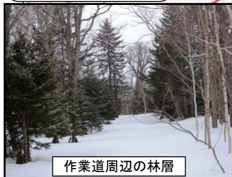
作業道周辺の林層