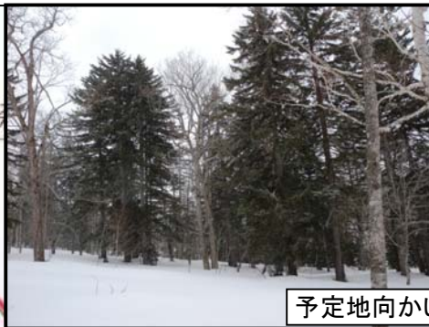
予定地向かい、アカエゾ植栽木