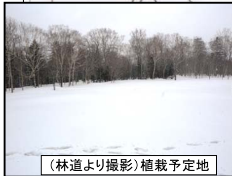
(林道より撮影)植栽予定地