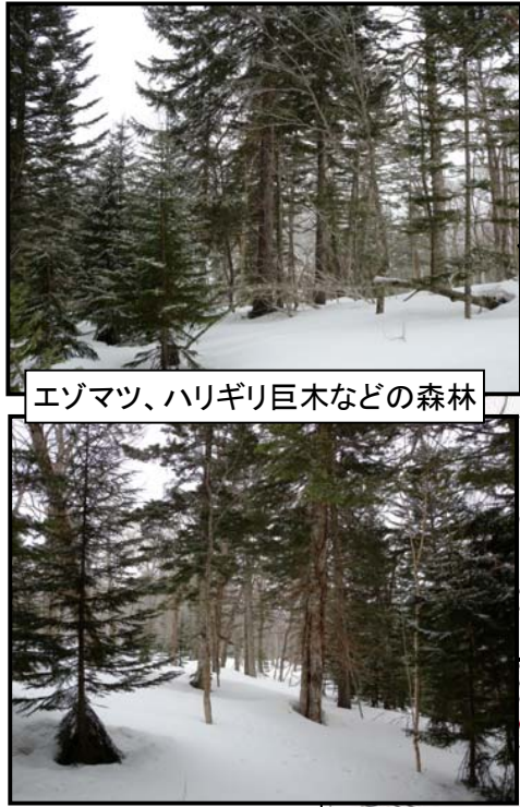
エゾマツ、ハリギリ巨木などの森林