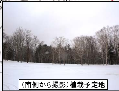
(南側から撮影)植栽予定地