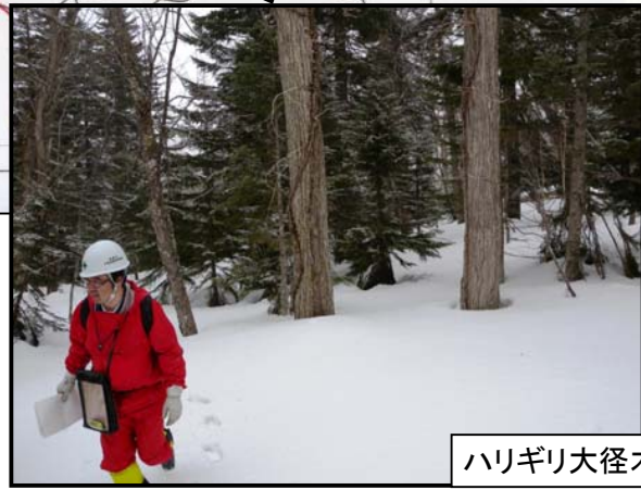
ハリギリ大径木・巨木