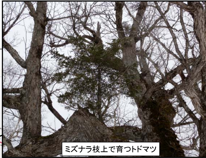
ミズナラ枝上で育つトドマツ