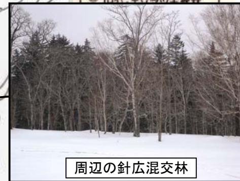
周辺の針広混交林